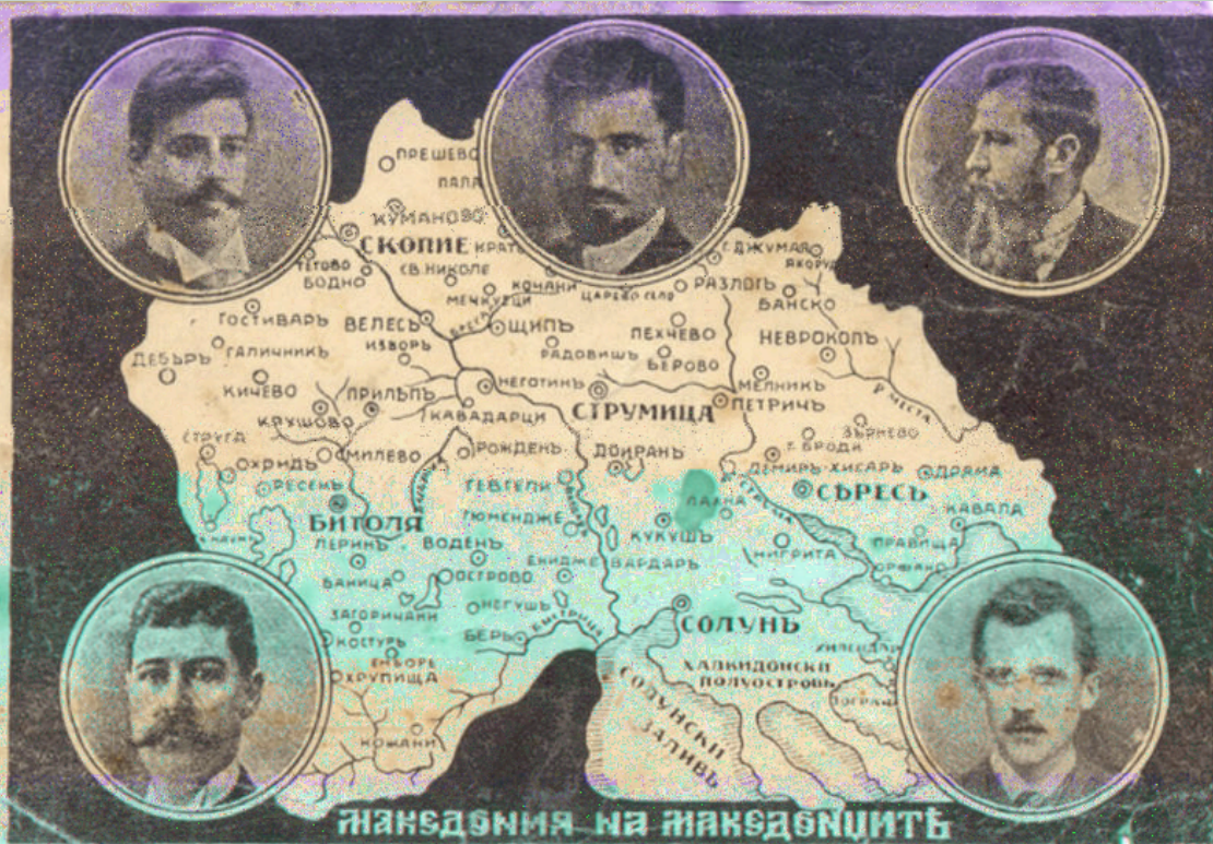
Afise e VMRO-së Teksti në afise: Македонија македонасве