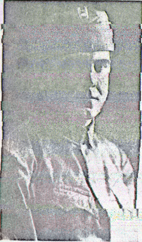
Ustaški Poglavnik Dr. Ante Pavelić vodja hrvatskog oslobodilačkog pokreta.